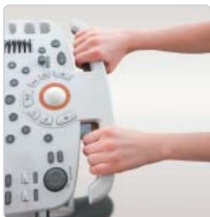
Painel de controle com regulagem de altura

Seu design ergonômico e sua praticidade operacional, assim como as modernas funções QuickScan™, FSI™ e THI proporcionam diagnósticos mais precisos, com conforto e rapidez.