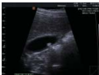
Colelitíase em 2D