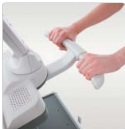
Puxador frontal e traseiro