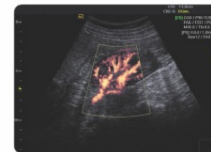
Rim no modo Power Doppler